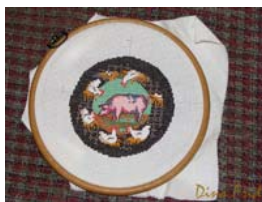
Схема «Деревенский дворик», которой я воспользовалась, найдена на просторах интернета. Вы можете скачать ее здесь .

Выполняем вышивку крестиком на квадратном кусочке канвы. Размер готового рисунка 12 см.