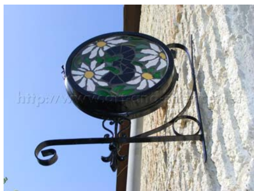
Вид с улицы