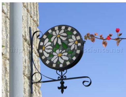
Вид с улицы и со двора