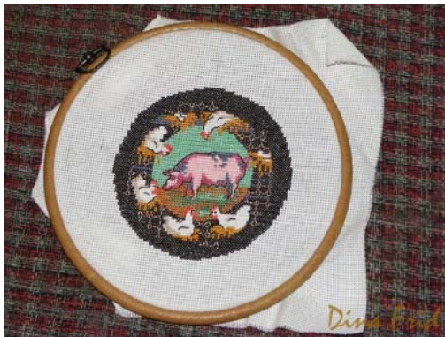
Схема "Деревенский дворик", которой я воспользовалась, найдена на просторах интернета.